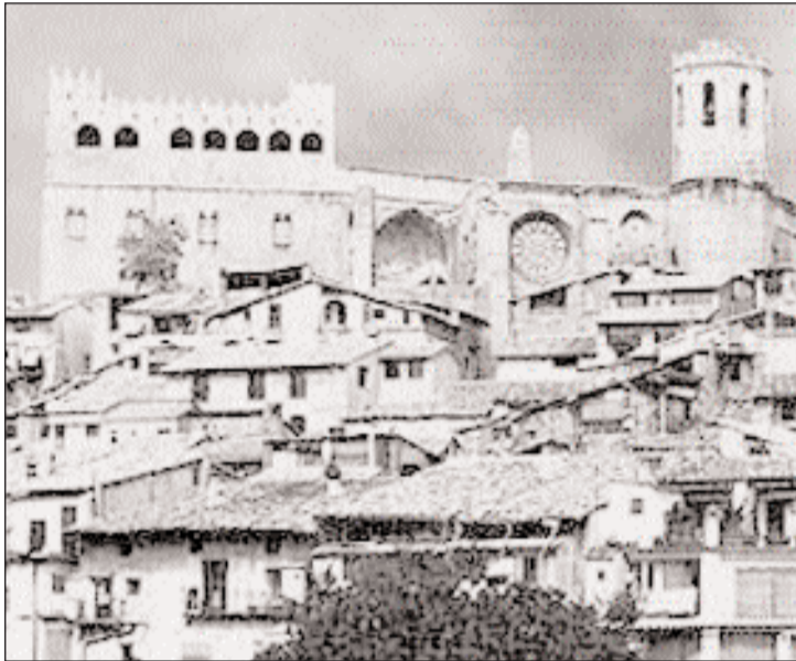
Imagen antigua de la localidad de Valderrobres

"Ha querido conmemorar Valderrobres con una realidad aquel aniversario el pasado jueves (1 de abril) inauguró un cuartel de la Guardia Civil, ofertando a 1 vez una enseña de la Patria a las