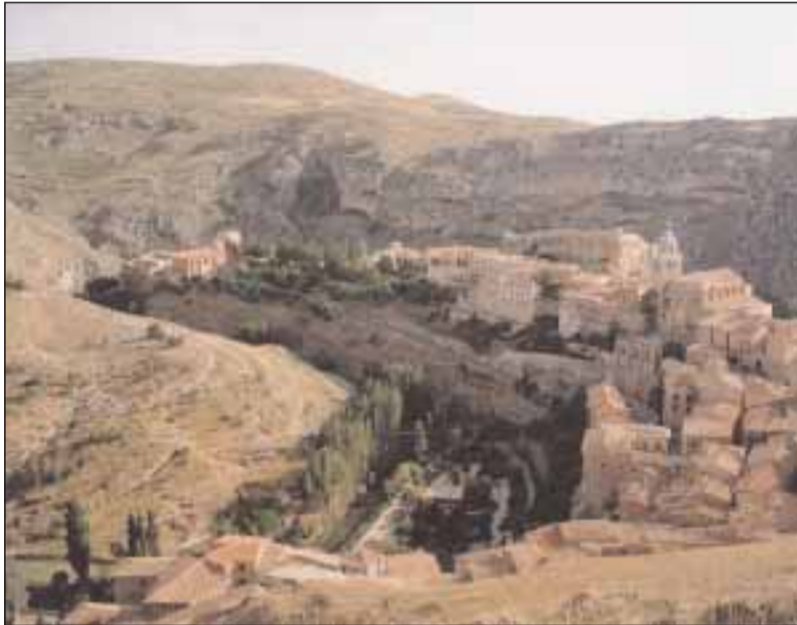
Panorámica de la ciudad de Albarracín

escuelas en el Arrabal, reconstruyó la iglesia de Santiago y el acceso a la ciudad. Estaban en proyecto el cuartel de la Guardia Civil, tres escuelas, y la retirada de escombros.