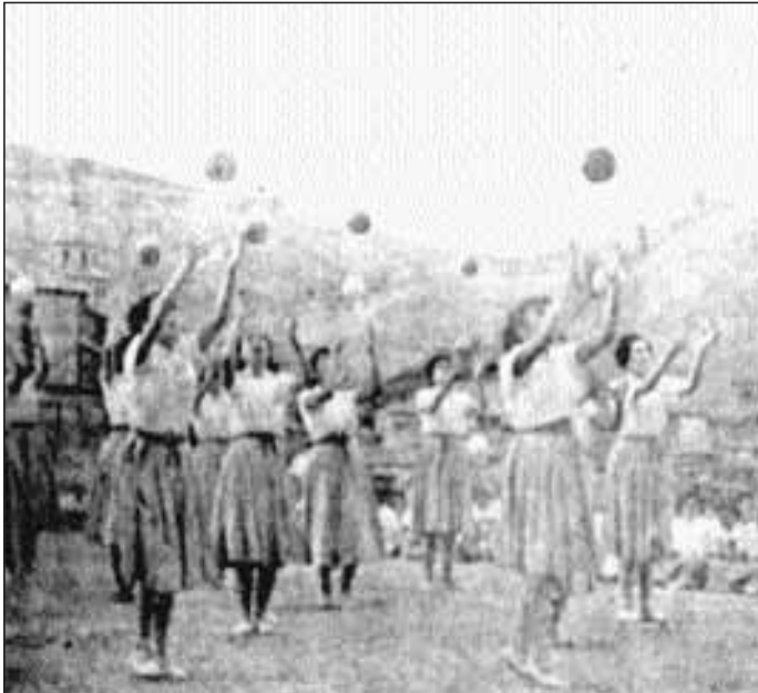
Chicas de la Sección Femenina en un campamento en Albarracín