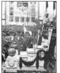
Cortes de Cádiz

gravemente herido al ser atacado por tres malhechores cuando volvía a su casa tras pronunciar un discurso en las Cortes de Cádiz.