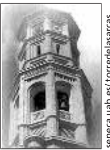
Torre de las Arcas