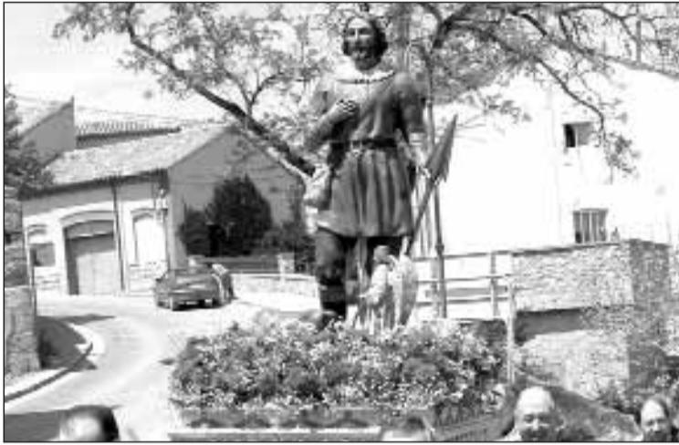
Imagen de San Isidro Labrador, en la procesión del año pasado

La agricultura tenía mayor importancia que ahora hace 50 años y por eso la celebración del patrón San Isidro era más brillante. Organizaba los actos de Cámara Agraria, con la colaboración de diferentes asociaciones.