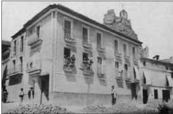
Foto antigua de Villed

En Rudilla narra el cronista que el templo "resultó destruido, como casi todo el pueblo, por los rojos en sus feroces ataques para vencer la resistencia heroica de los rudillanos". Ese día por la mañana se procedió a su bendición, se cantaron solemnes tercias, hubo una procesión presidida por el