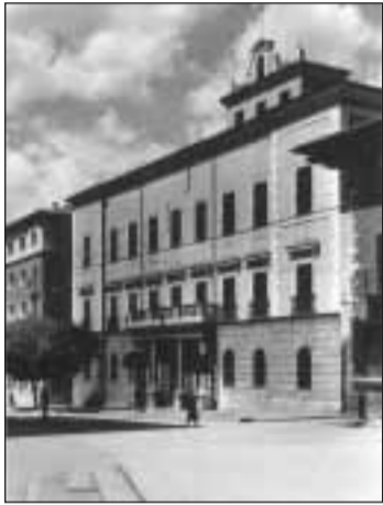
Casa Consistorial de Teruel