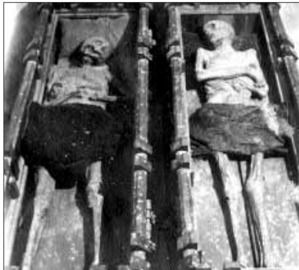
Las momias de los Amantes, antes del mausoleo