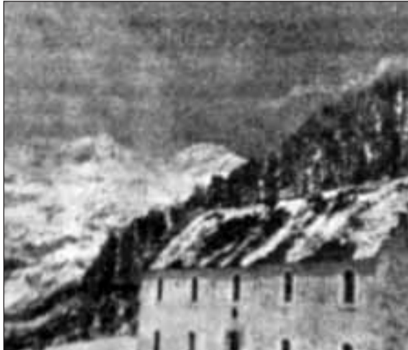
El refugio de la Renclusa, fin de la primera etapa

“En la cima y sobre un pedestal de cemento revestido de aluminio, todo