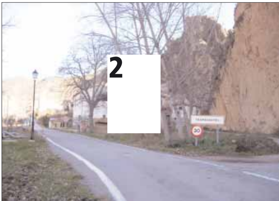
Tramacastiel cuenta al día de hoy con 58 de los 120 habitantes del término