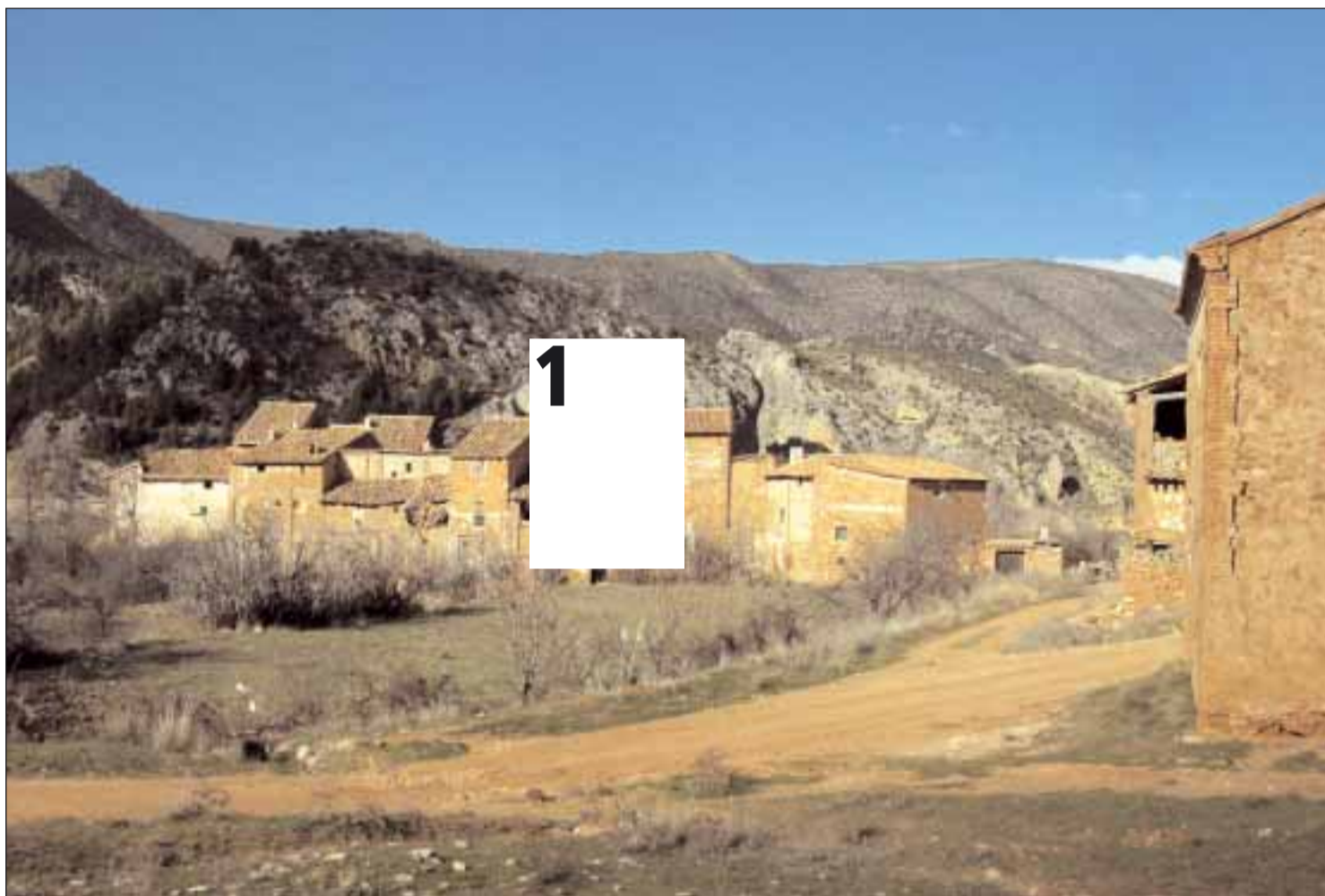
El Campo, una aldea de Vilhel en el que hoy hay censado un solo habitante, pero que no reside de continuo en este lugar.

Hay dos localidades, Albalate y Alcañiz, con más de un centenar de habitantes en diseminados. Otros tienen "barrios de barrios". Por