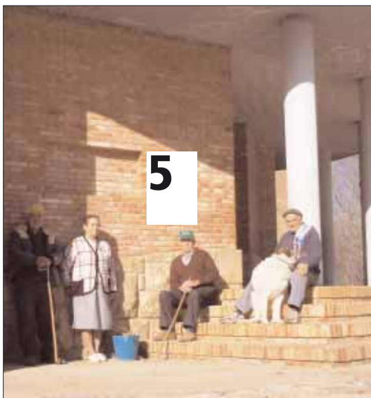
Los vecinos de Más de la Cabrera destacan la bondad del clima