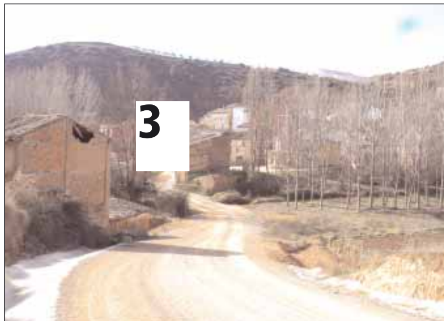
Más de la Cabrera, donde residen 62 a pesar de ser una aldea