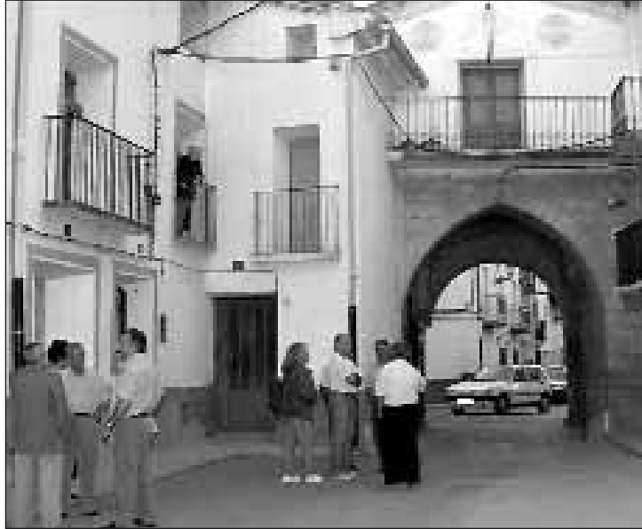
La Puebla de Valverde, en la foto, ganó once habitantes

Otra comarca que obtuvo unos resultados por debajo de la media fue la de Cuencas Mineras, si bien sus prin-