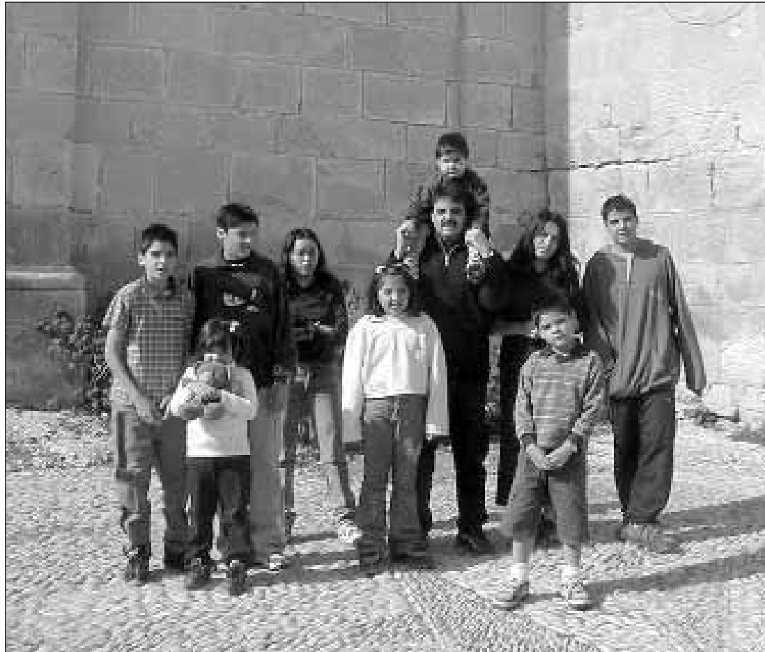
La llegada de familias inmigrantes está revitalizando Aguaviva y otros municipios

El alcalde indicó que a Foz Calanda ya han llegado cuatro nuevas familias y han perdido la quinta; a Berge tres, y otras a Barrachina, Argente, Fuentespalda, Fórnoles, Peñarroya de Tastavins,