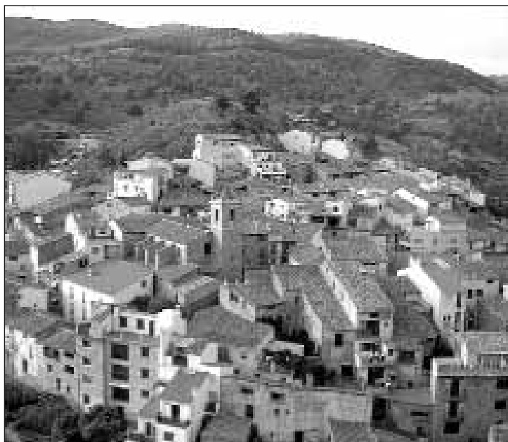
Casco urbano de Olba, en el cauce del Mijares

Fuentes de Rubielos, que ganaron 18 y 12 vecinos a pesar de ser pueblos de pequeño tamaño, sí que son debidos a la inmigración. La llegada de varias parejas jóvenes procedentes de Zaragoza y Barcelona a Fuentes propició que en el curso 2000/2001 fuese necesario ampliar la escuela con otro maestro, gracias a iniciativas como la creación de una urbanización de ocho casas