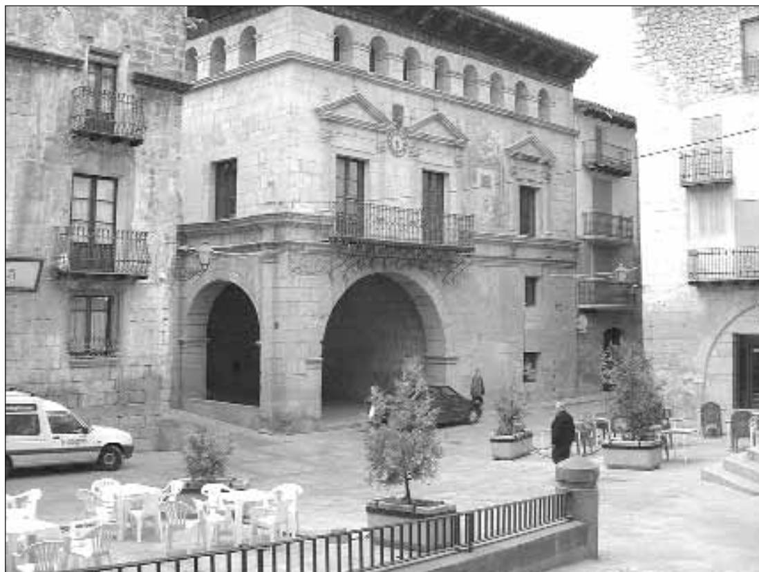
Valderrobres es una de las localidades con mejor comportamiento demográfico de la provincia