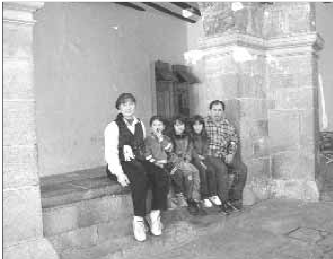
Paraguayos en Albarracín, que ganó 13 habitantes; el mayor crecimiento de los últimos años