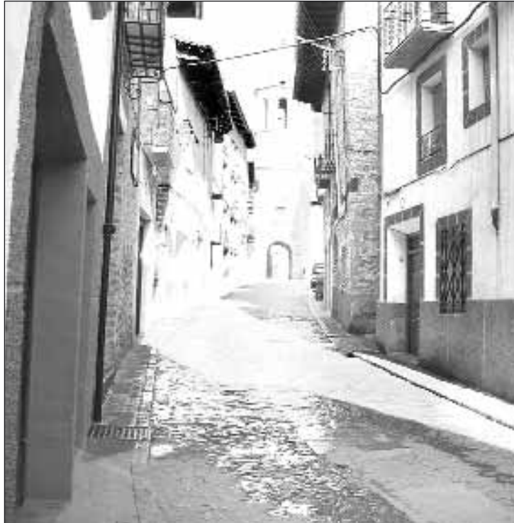
Cantavieja ha sido una de las sorpresas positivas del último censo

Las pérdidas es la tónica general. Nueve pueblos han visto reducida en estos 16 años su población a la mitad o menos, todos de pequeño