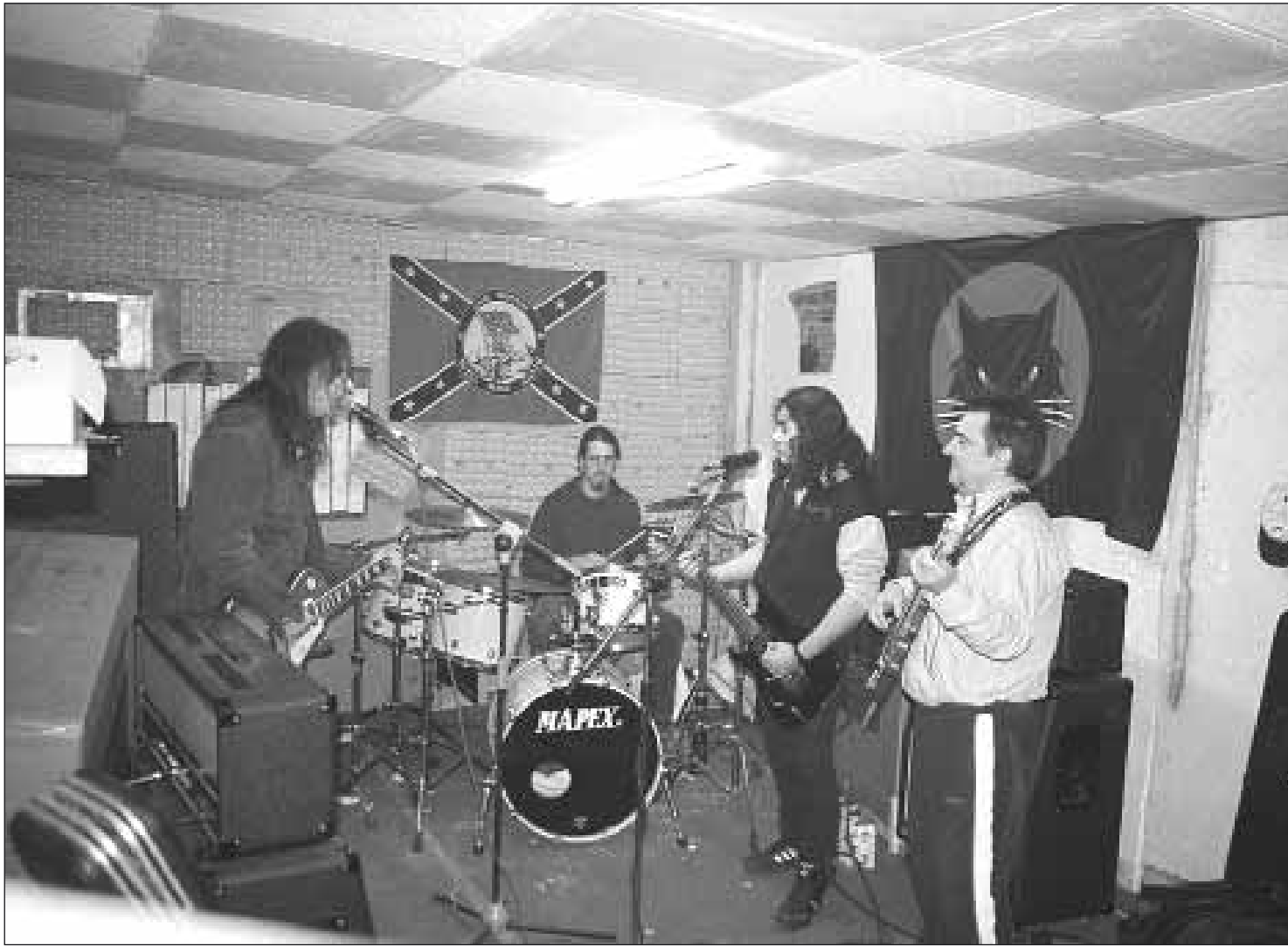
"Los Visitantes" en un local del barrio de Jorgito que ha sido utilizado por distintos conjuntos turolenses desde los años 70.